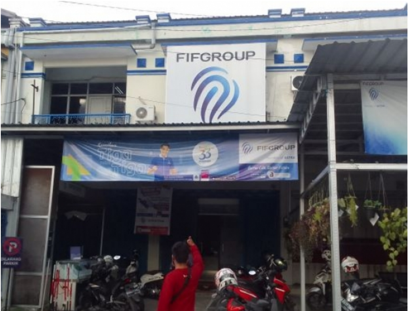
Kantor. FIF Group Di Jalan RTA Milino Kota Palangka Raya

PALANGKA RAYA - Kembali berulah, depkolektor PT Fideral Internasional Finance Group (FIFI Group), merampas dan memaksa mengambil unit motor